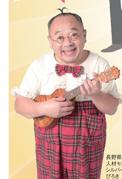
長野県シルバー人材センター連合会 シルバー大使 びるき