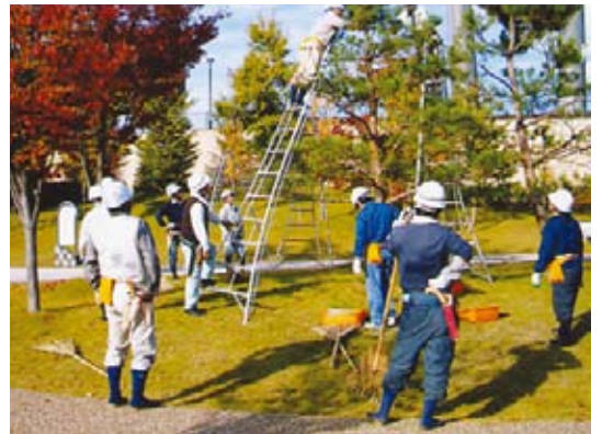
▲技能講習(庭木・庭園管理)