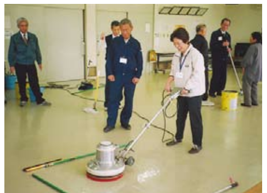
▲技能講習(オフィスクリーニング)