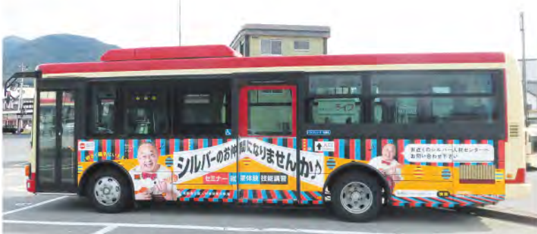
▲路線バスへのラッピング広告