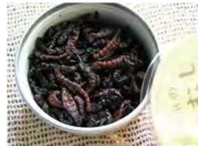
伊那谷名物 ザザムシ