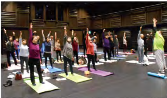
健康講座：各地区単位で開催