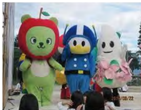
右から伊那市イーナちゃん、県警ライポくん、長野県アルクマ