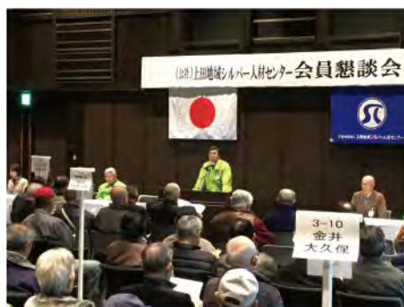
地区別会員懇談会

からも少しずつ減っています。一昨年度特定費用準備資金として三百万円を積み立て三か年計画で「会員拡大特別対策事業」として、様々な啓発活動、勧誘活動を展開しています。また、会員の口コミによる勧誘にも力を入れています。会員の健康保持も大切な課題です。会員の高齢化もあり、ちょっとしたことで転倒し骨折に結び付く事故が発生しています。昨年度から総合スポーツクラブに委託し、会員を対象とした「健康講座」を開催するとともに、定時総会時には「健康相談コーナー」を設置し、体組成計での測定や看護師による相談を行いました。会員の皆さんには「できるだけ長く、元気で活躍していただきたい」そのための事業にも積極的に取り組むと考えています。