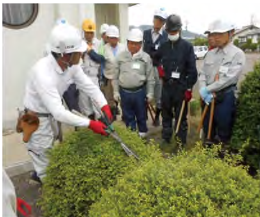
庭木の刈込講習会