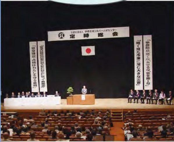
令和元年度定時総会