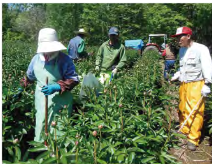
会員就業によるシャクヤク収穫