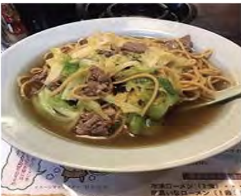
伊那谷グルメ ローマン