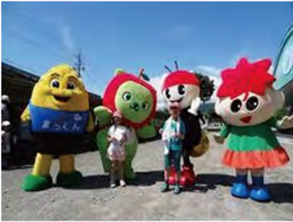
右から箕輪町もみじちゃん、辰野町ピッカリちゃん、長野県アルクマ、南箕輪村まっくん

●適正就業の観点から、派遣事業を拡大し会員への配分金増を図る。 令和という新しい元号の元、昭和生まれのシルバー世代の活躍を祈るばかりです。